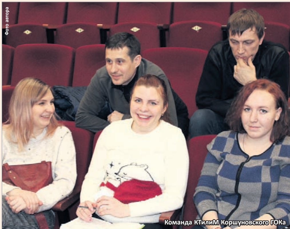
Команда КТилиМ Коршуновского ГОКа

Известно, что сложностей наши игроки не боятся. Где не знают, там присочинят. Но в целом было видно — рекомендации учтены. Уровень подготовки позволял давать, если не стопроцентно правильные ответы, то хотя бы приблизительные. Например, имея в виду ответ «пачка», в зачет организаторы приняли